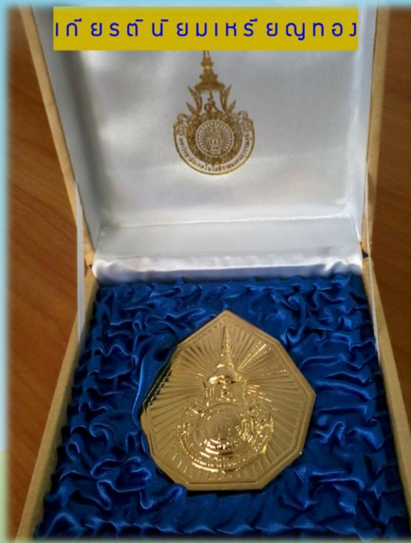
เกียรติบัตรเหรียญทอง